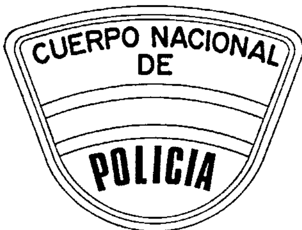
Figs. h-1 y h-2