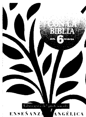
Figura 2. Libro para la enseñanza de la religión evangélica “Crecer con la Biblia” para 6º de Educación Primaria.

El proyecto “Descubrir el Islam”, parte de un Acuerdo de cooperación con el Estado español, en el que participan la Comisión Islámica de España (CIE), la editorial Akal y la Fundación Pluralismo y Convivencia.