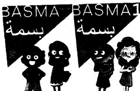
Figura 4. Libros Basma Inicial y Basma 1 para el aprendizaje de la Lengua Árabe.

En materia del aprendizaje de la lengua extranjera como fuente de conocimiento la FP y C genera un nuevo recurso didáctico: BASMA. Este proyecto, tiene como objetivo la edición de materiales didácticos y recursos educativos para el aprendizaje del árabe, consistente en la elaboración de libros de texto para la enseñanza y aprendizaje de la lengua árabe en la Educación Primaria y Secundaria.